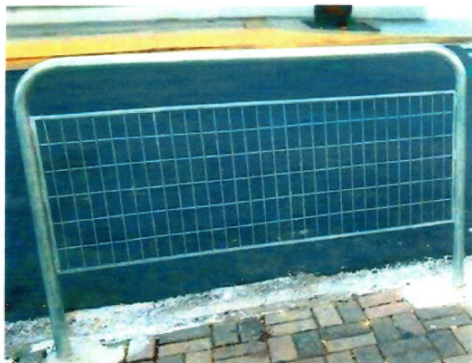
Figura ilustrativa do gradil

Apresentar informações técnicas necessárias para fornecimento de grades de isolamento (Figura 1) cuja finalidade é o ordenar o fluxo de passageiros, proporcionando-lhes mais conforto e segurança nas dependências às estações operacionais da Companhia de Trens Metropolitanos de São Paulo – CPTM.